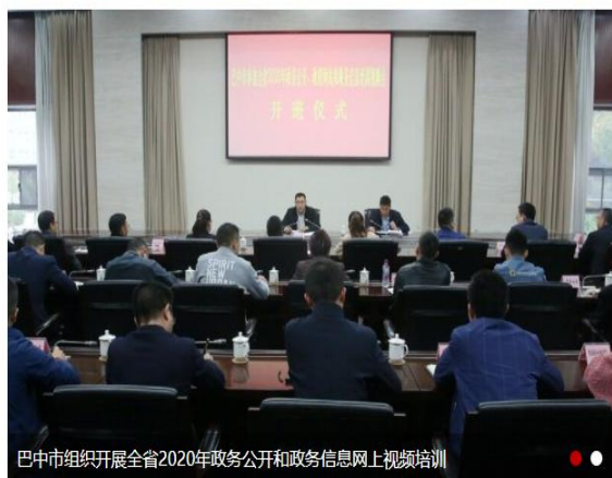
巴中市组织开展全省2020年政务公开和政务信息网上视频培训