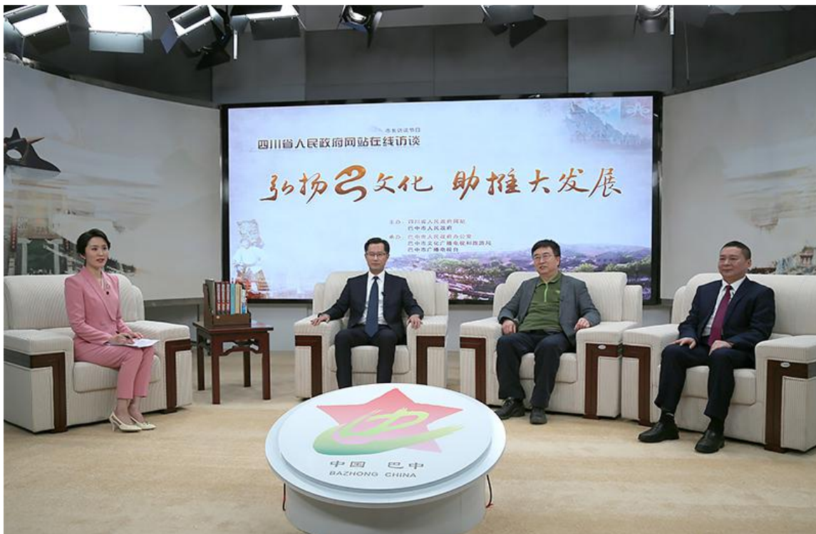
《市长访谈》（第23期）现场直播

全年开展《市长访谈》和《政务访谈》16期，省政府网站和新华网四川频道、四川观察、川观新闻、四川发布、封面新闻等省级主流媒体同步直播并深度宣传报道。