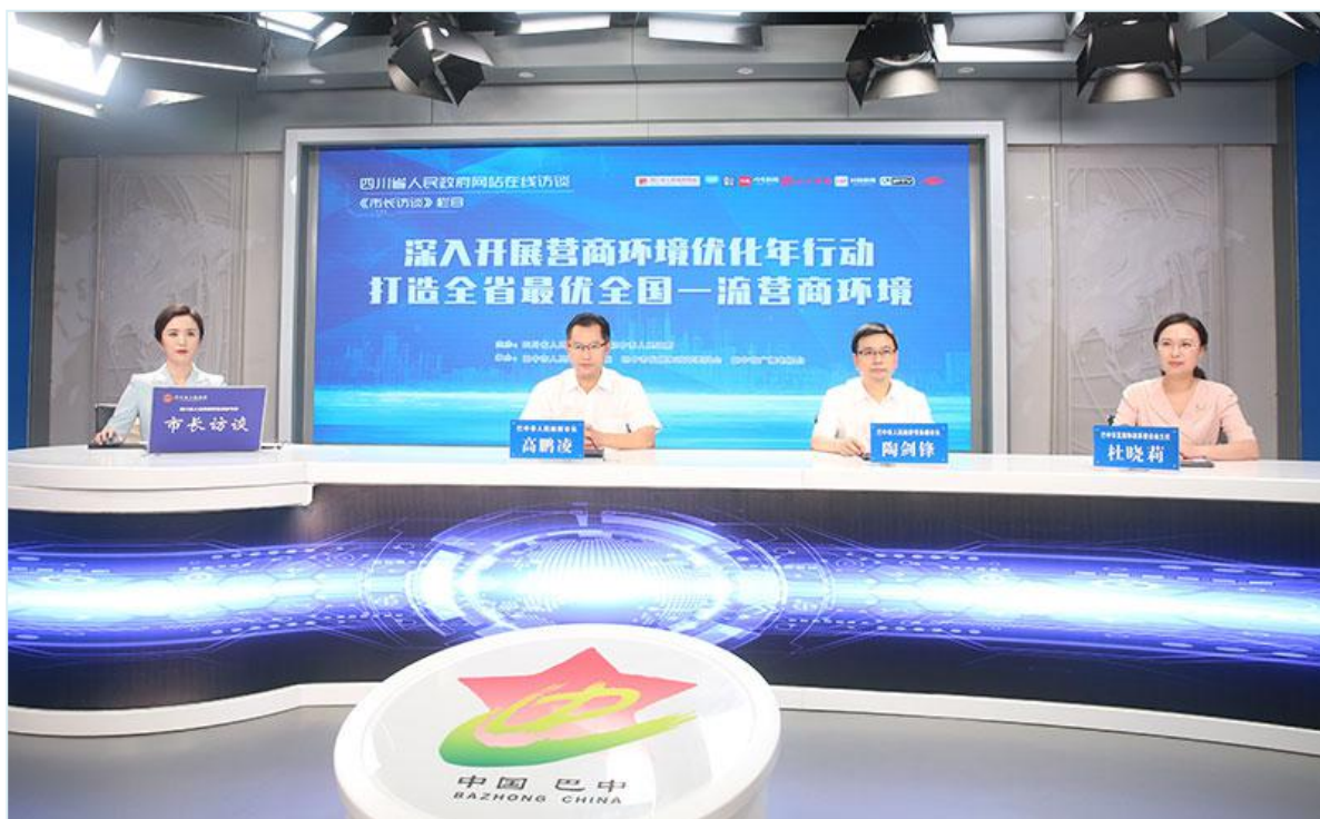
市长高鹏凌上线第 29 期《市长访谈》节目

2023 年，巴中市坚持以习近平新时代中国特色社会主义思想为指导，认真落实党中央、国务院和省委、省政府决策部署，坚持围绕中心、服务大局，不断深化新时代政务公开，持续加强主动公开力度，着力提升政府透明度和公信力。