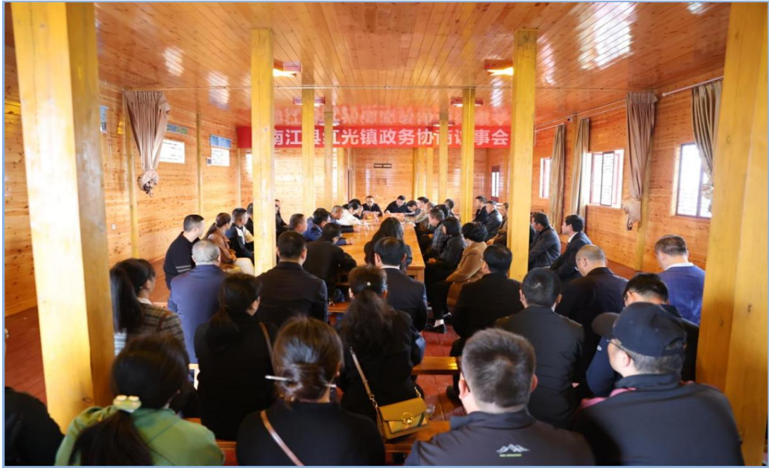
南江县红光镇柏山村召开“政务协商”议事会