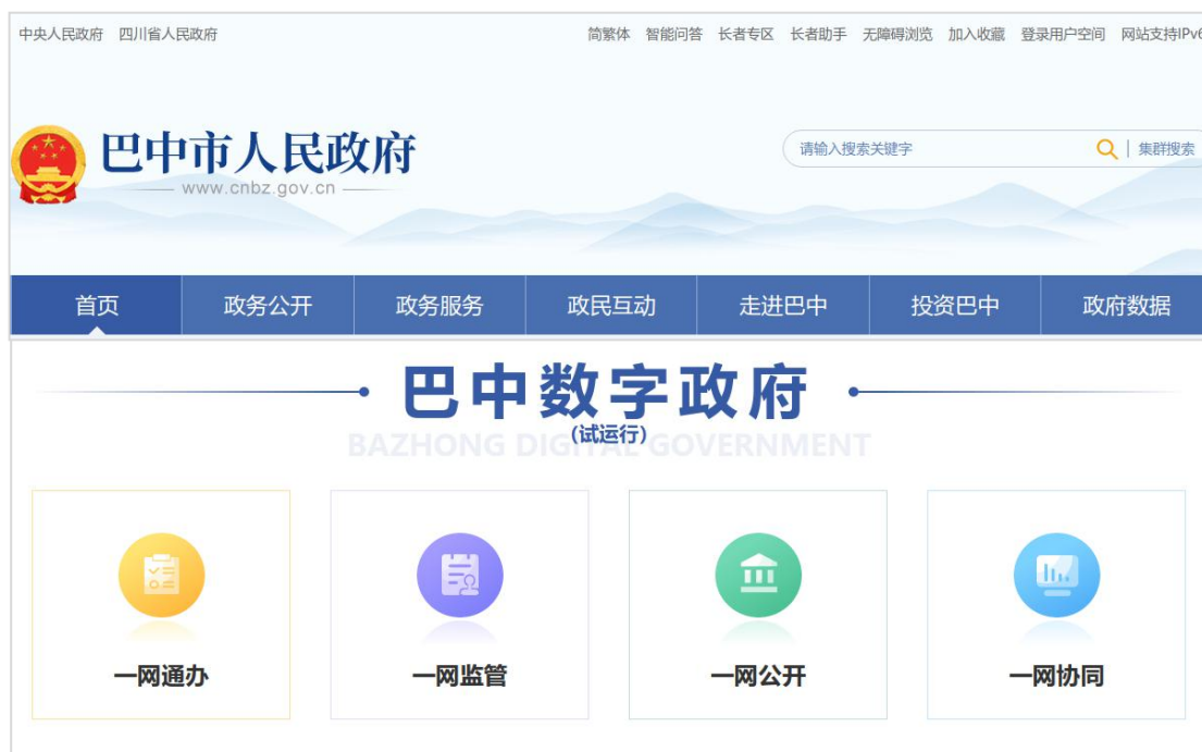
市政府门户网站建设数字政府专区