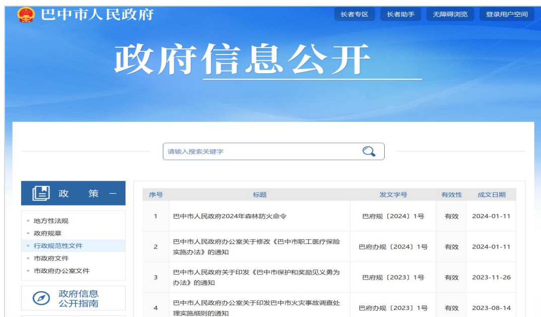
市政府门户网站集中展示行政规范性文件