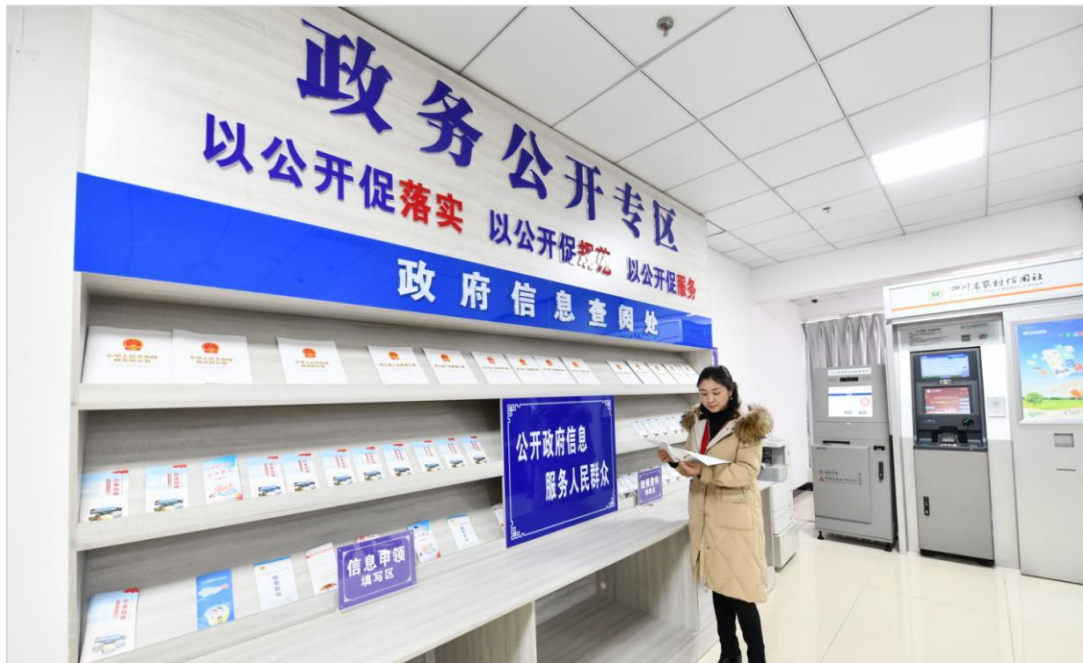
通江县在“市民之家”建设政务公开专区

（二）依申请公开。2023 年共接收政府信息公开申请 669 件，办结 658 件，结转下年度继续办理 11 件。办理完成的政府信息公开申请中，予以公开及部分公开 288 件，不予公开 50 件，无法提供 264 件，不予处理 40 件，其他处理 16 件。因政府信息公开申请引发行政复议 8 件，行政诉讼 23 件、撤诉 12 件。进一步规范办理工作流程，开展专题业务培训 2 次，共征集典型案例 10 个。