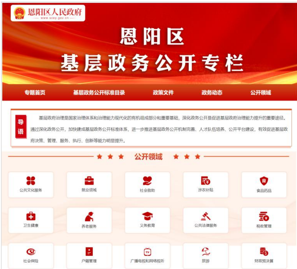
恩阳区开设基层政务公开专栏

指导各县（区）政府在门户网站新开设基层政务公开专栏，将 30 个领域 264 个事项信息集中公开。