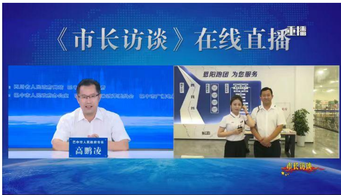
第 29 期《市长访谈》直播连线

紧扣营商环境、投资促进和工业强市等主题，共举办《市长访谈》和《政务访谈》全媒体直播节目 16 期，省政府网站和省级主流媒体同步直播和宣传报道，累计关注网友达 500 余万人次，回应网友问题 800 余个。