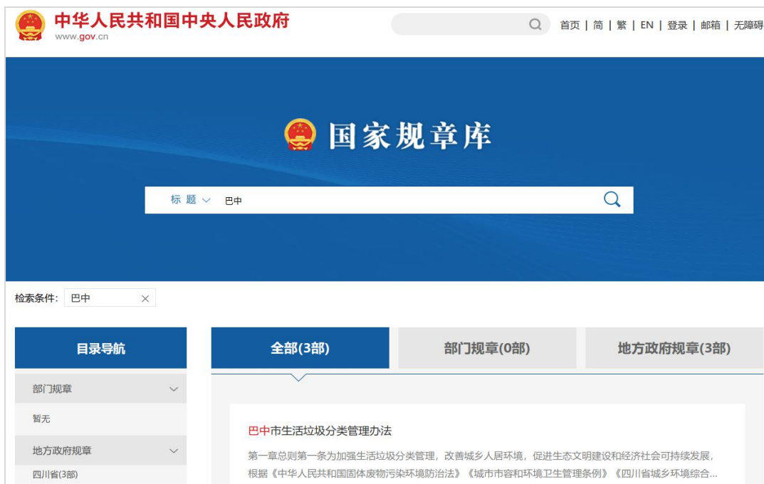
“国家规章库”收录巴中规章

(三) 政府信息管理。在全市开展规范性文件清理行动，废止行政规范性文件 50 件。公开现行有效市政府规章 3 部、行政规范性文件 491 件。