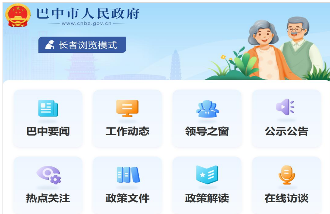
市政府门户网站适老化改造

市政府网站适老化改造，持续优化检索、无障碍等功能，在市、县政府门户网站推出“四个一网”数字政府专区。