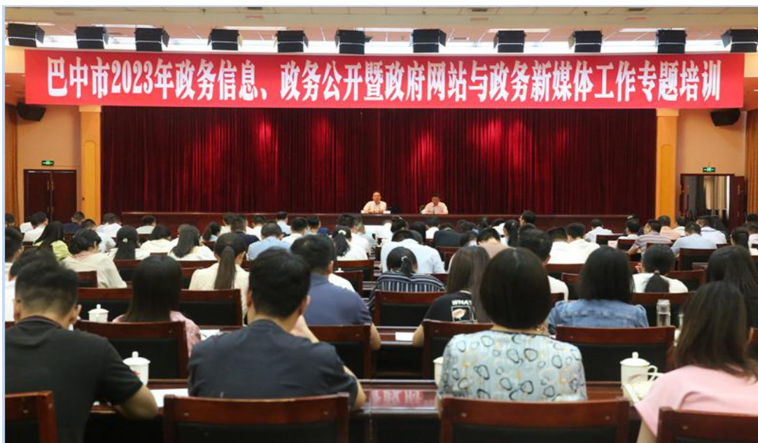
省政府信息公开办主任赵晓斌来巴授课

全年组织政务公开集中调研 2 次，举办专题业务培训 12 次。围绕国办第三方评估和省专项检查指标，定期或不定期开展政务公开专项检查。