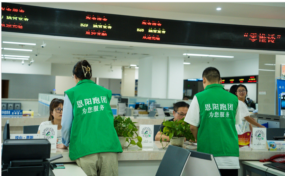
恩阳区通过“恩阳跑团”为企业群众提供帮办代办服务