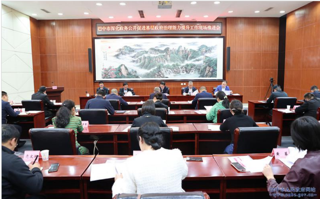
召开全市深化政务公开促进基层政府治理能力提升工作现场推进会

深入推进恩阳区、南江县、平昌县全省第二批深化政务公开促进基层政府治理能力提升先行县工作，有效带动全市基层政府加快提升治理能力和水平。