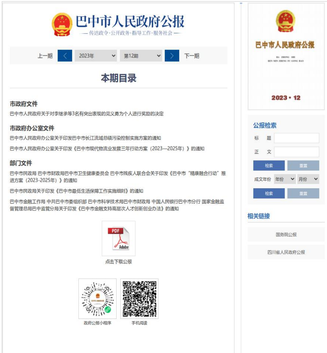
《巴中市人民政府公报》电子版和微信小程序

加强政府公报数据库建设，开发政府公报微信小程序，全年发布《巴中市人民政府公报》12期，收录2016年以来政府公报96期。