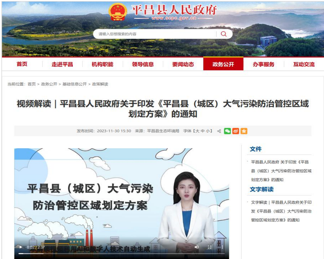
平昌县开发“AI+数字人”小程序，将文字解读自动生成动画解读