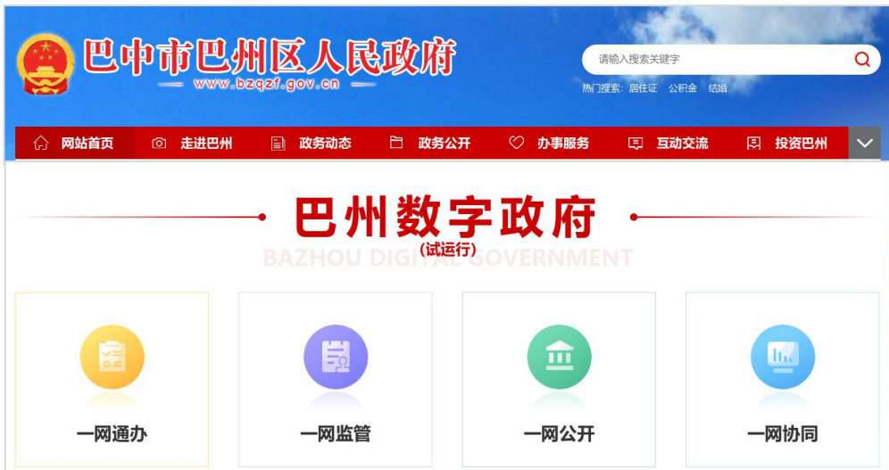
巴州区政府门户网站建设数字政府专区

指导各县（区）政府在门户网站新开设基层政务公开专栏，将 30 个领域 264 个事项信息集中公开。